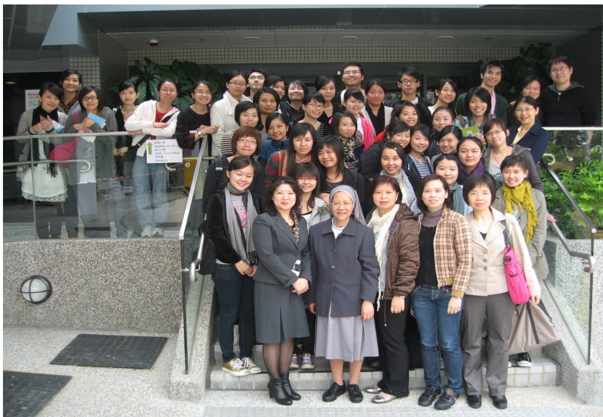
56班護生與胡修女及教師們參觀“香港賽馬會癌症康復中心”

無可否認，癌症是一種可怕的疾病。而該康復中心能為病人提供一個舒適的地方，照料到他們心靈上的需要，以助長復原。