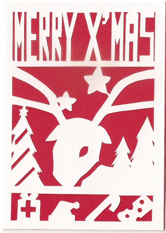
冠軍 (已送予本院院長周修女)

護校於 2008 年 11 月尾舉辦了一年一度的聖誕咭設計比賽,參賽反應熱烈,共收到 27 份參賽作品。