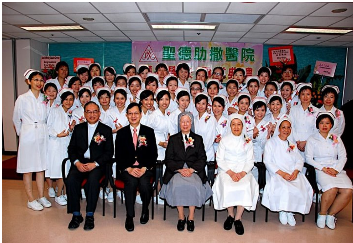
55 班登記護士學生畢業相片

沒有離別的痛苦，又怎會有相聚的快樂呢?我相信，在痛哭離別後，我們仍會有重聚的一日。最後，祝願各位同學前程似錦，工作順利!