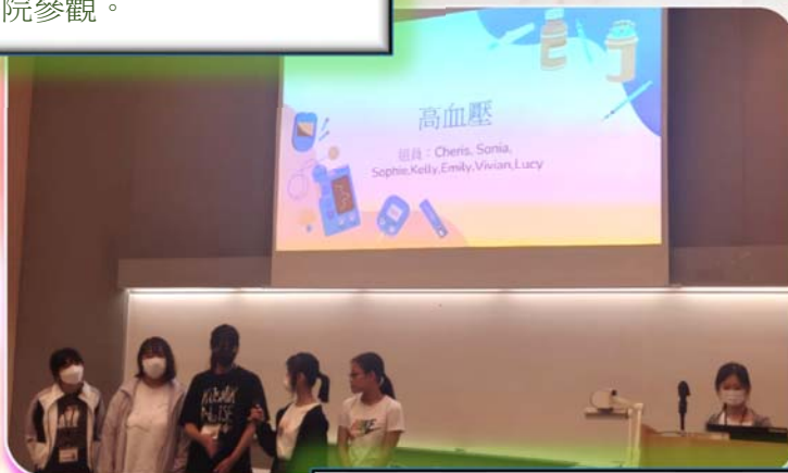
Let Me Fly 職場體驗計劃學員的畢業作品 - 海報和健康講座。