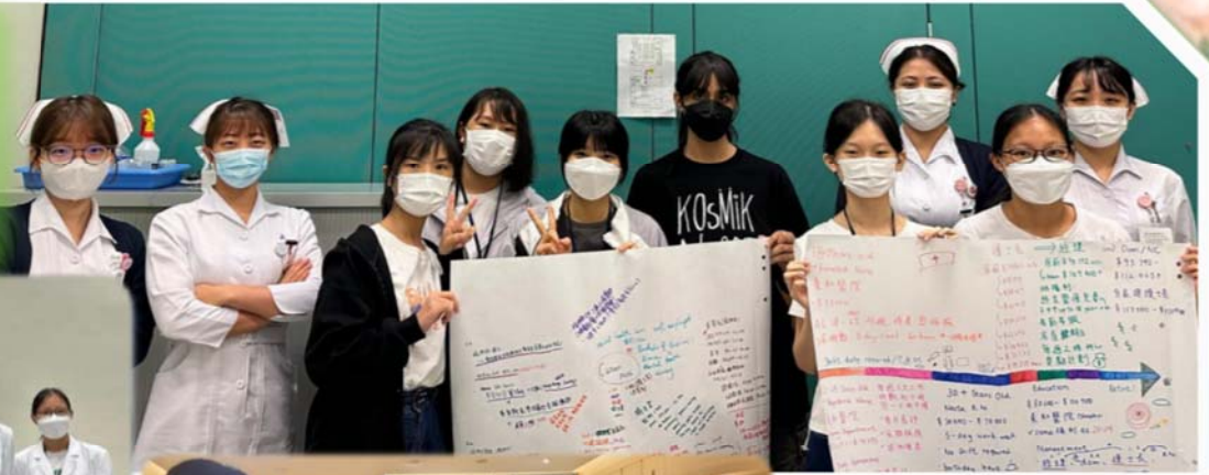
學生大使和 Let Me Fly 職場體驗計劃的學員一起探討護理行業的職業發展路徑。