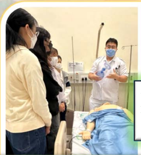
學生大使在模擬實驗室向 Let Me Fly 職場體驗計劃的學員示範搶救病人。