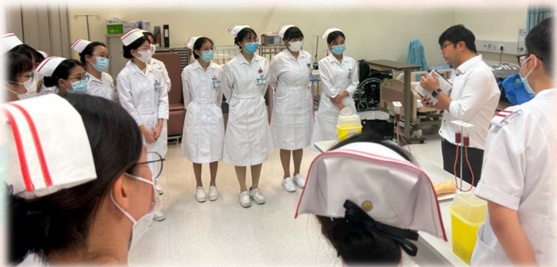
78班靜脈穿刺工作坊