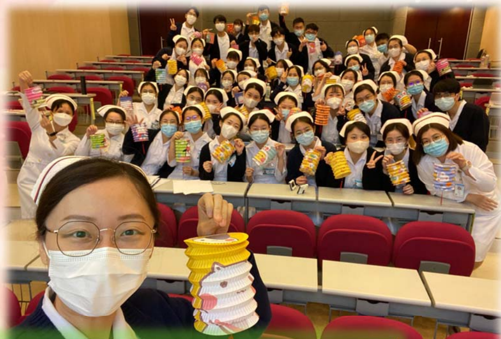
80 班同學其中一科口頭報告的日子正巧是中秋節。