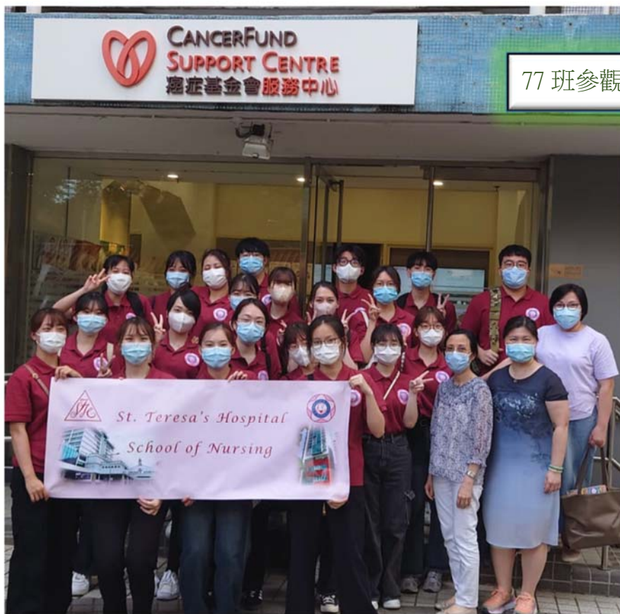
77班參觀癌症基金會