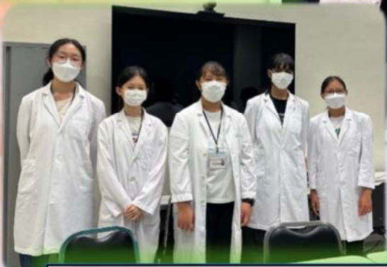
感謝醫院的安排，Let Me Fly 職場體驗計劃的學員有幸在畢業前穿上白袍到醫院參觀。