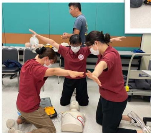
77班基本生命支援術工作坊