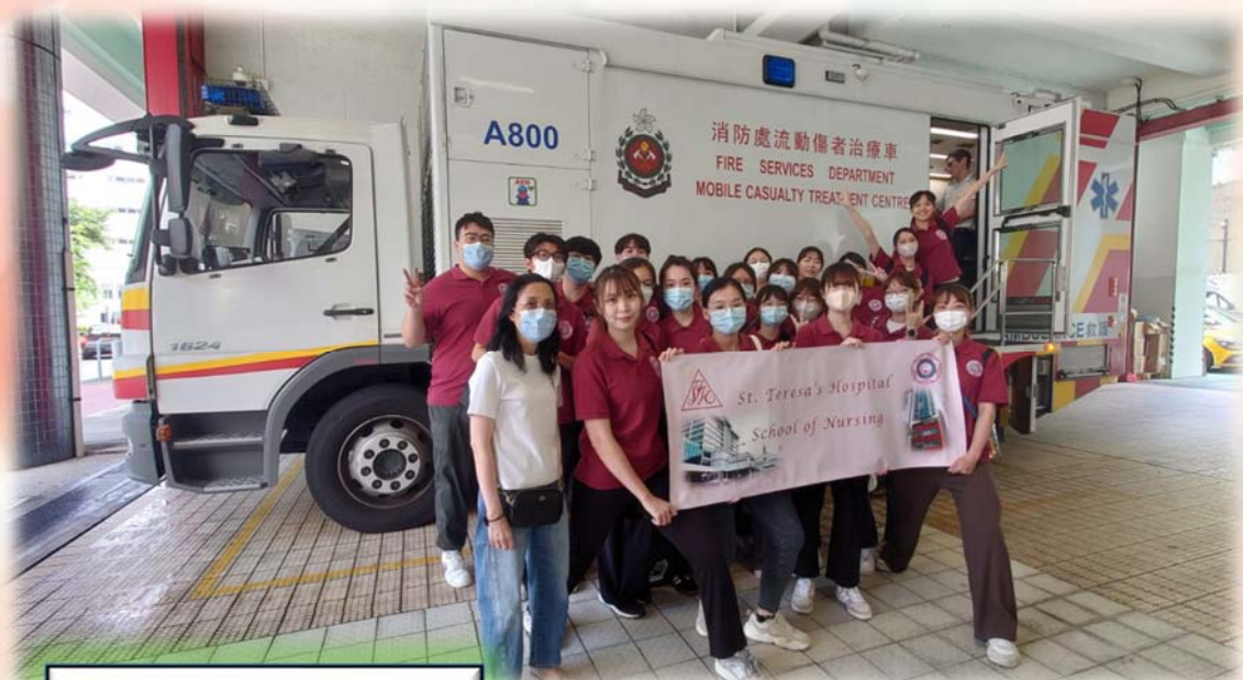
77 班參觀何文田救護站