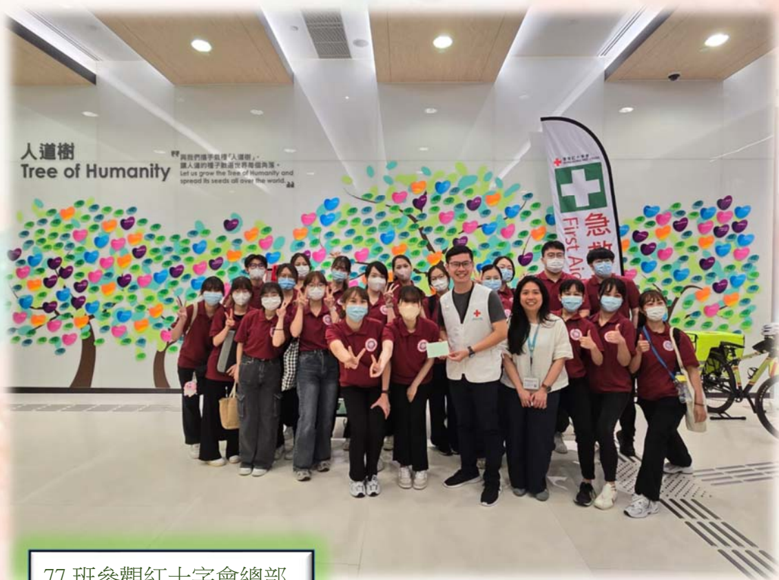
77 班參觀紅十字會總部