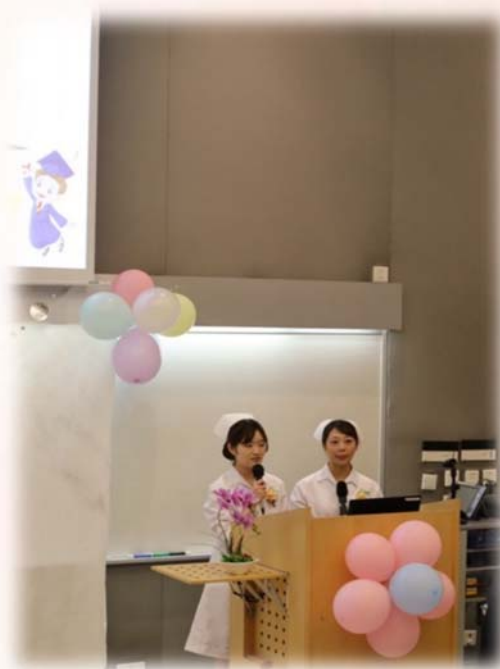
八號風球也不影響全體師生認真的彩排。