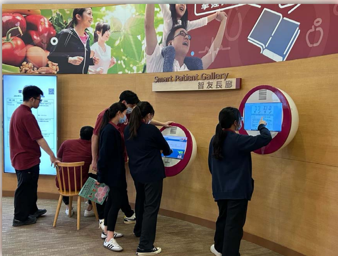
78 班參觀醫管局健康資訊天地