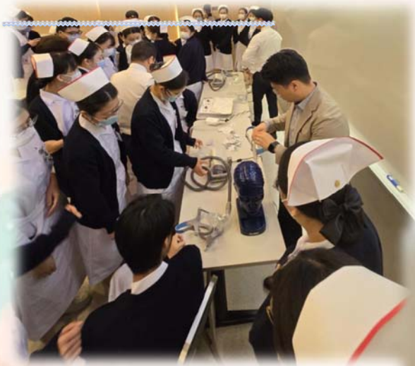
嘉賓講師讓 80 班同學試戴睡眠呼吸機。