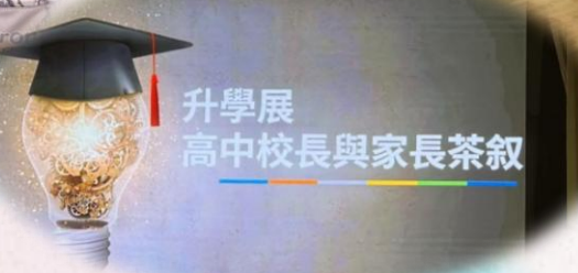
升學展 高中校長與家長茶叙

聖德肋撒醫院護士學校 普通科護理高級文憑 (登記護士) Higher Diploma in General Nursing (Enrolled Nurse) Programme 修業年期：2年(全日制)